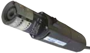
ESG Plus 2