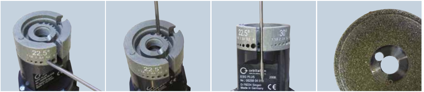
Elektroden anschleifen: 4 unterschiedliche Winkel, 6 unterschiedliche Elektroden-durchmesser