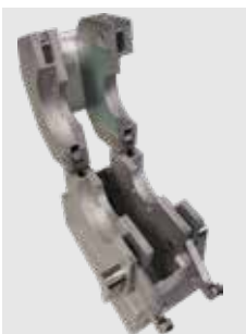
Pratici blocchi di tensione per un comodo utilizzo con una sola mano