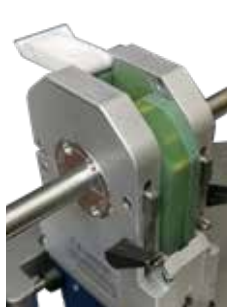
Coperchio della testa di saldatura incernierato "FlipCover"