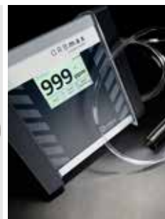
Vasto programma di accessori, ad esempio misuratore dell'ossigeno residuo ORBmax