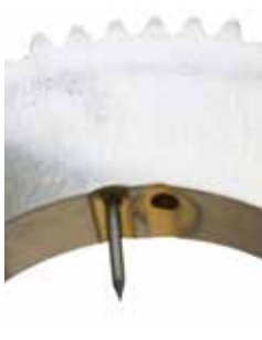
Montaggio più facile degli elettrodi grazie ai segni per \varnothing 1,0/1,6 mm (0.039"/0.063")