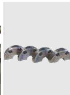
Collari di serraggio specifici per il diametro (4 pezzi ciascuno, disponibili separatamente)