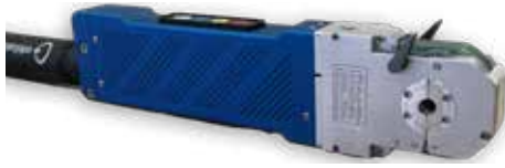
ORBIWELD 19 HD