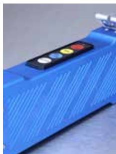
Robusta e stabile impugnatura in alluminio con pulsantiera integrata