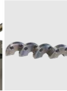
Dispositifs de serrage spécifiques au diamètre (chacun 4 pièces, large et fin) disponibles séparément