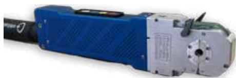
ORBIWELD 19 HD