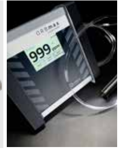
Programme d'accessoires étendu, par ex. instrument de mesure d'oxygène résiduel ORBmax