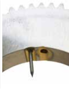
Placement plus simple des électrodes grâce aux marquages pour Ø 1,0/1,6 mm (0,039"/0,063")