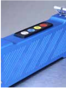
Poignée en aluminium robuste et solide avec panneau de commande intégré