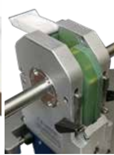
Couverture de la tête de soudage rabattable "Flip Cover"