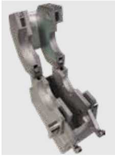
Fermetures de serrage pratiques pour une utilisation confortable d'une seule main