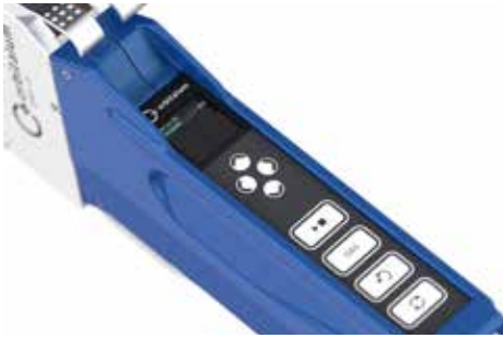
Unité de commande intégrée dans la coque en aluminium avec écran.