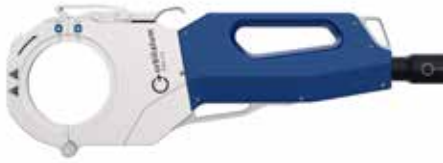
ORBIWELD X 3.0

Les dispositifs de serrage ne sont pas inclus dans la livraison.