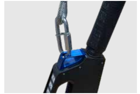
Interface de fixation mécanique centrale universelle pour la protection contre les chutes.