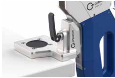
Fixation de table robuste en aluminium pour une fixation sur le bord ou la surface de la table.