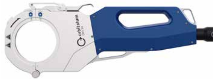
ORBIWELD X 3.0