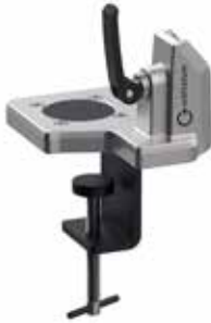
Support de table OWX

Le support de table en aluminium (anodisé) permet, grâce à son dispositif de serrage rapide, de déposer et de fixer confortablement et en toute sécurité les têtes de soudage de la série X d'ORBIWELD. Il peut être serré sur les bords des plans de travail, vissé sur les plans de travail ou intégré dans des systèmes de fixation alternatifs. En outre, la base peut être déplacée de 90° sur l'équerre de montage, ce qui offre une flexibilité supplémentaire.