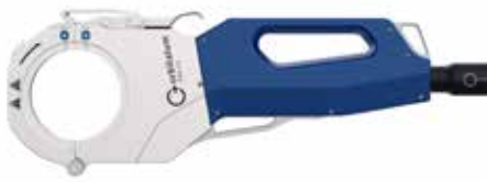
ORBIWELD X 3.0

I collari di serraggio non sono in dotazione.