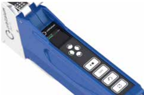
Pannello di controllo con display integrato nel guscio di alluminio.