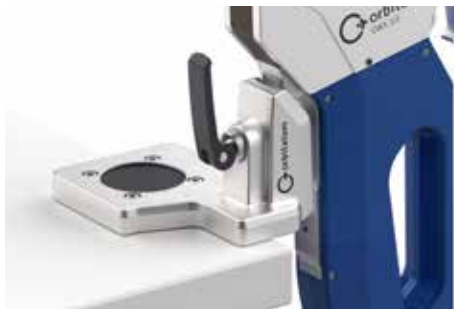
Robusto supporto da tavolo in alluminio per il fissaggio al bordo o alla superficie del tavolo.