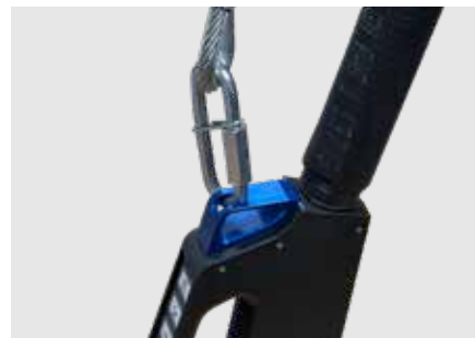
Interfaccia di fissaggio meccanico centrale universale per la protezione dalle cadute