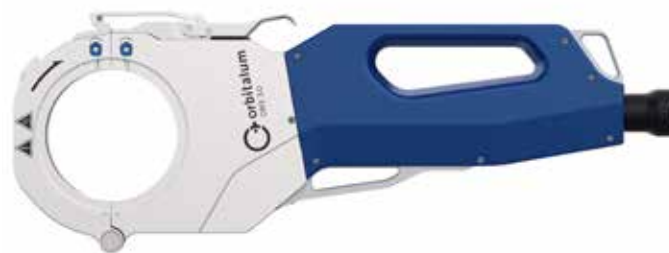
ORBIWELD X 3.0