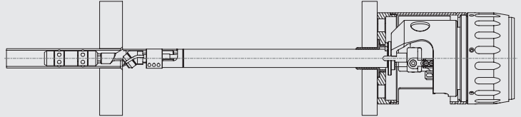
Innenbrenner: Zum Schweißen von zurück- gesetzten Rohren und Hinter- boden-Anwendungen