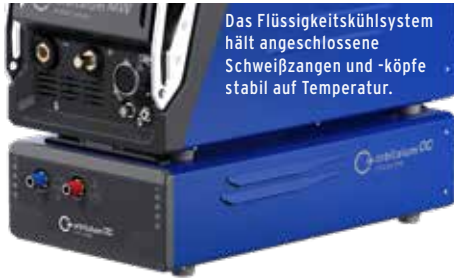
Mobile Welder OC PLUS

Das Flüssigkeitskühlsystem hält angeschlossene Schweißzangen und -köpfe stabil auf Temperatur.