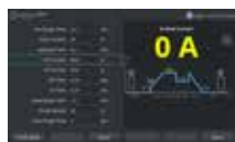
Interface Manuelles Schweißen