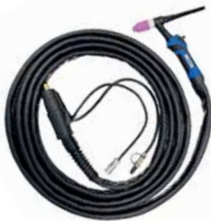
Gasgekühlter WIG-Handbrenner MW mit 6 m Schlauchpaket (optional)