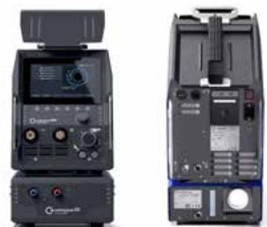
Mobile Welder OC PLUS Vorder- und Rückansicht

einem WIG-Handbrenner möglich und erweitert somit die Anwendungsmöglichkeiten, um flexibel Heftarbeiten durchzuführen und an mit Orbitalschweißköpfen unzugänglichen Stellen unkompliziert manuelle Schweißverbindungen herzustellen - eine Stromquelle für alle Herausforderungen im modernen Rohrleitungsbau.