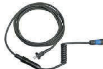
Cavo flessibile girevole