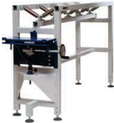
Rulliera per tubi, unità di base