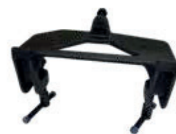
Piastra di montaggio rapido con morsetti a vite