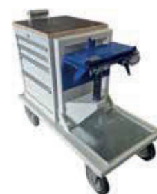
Postazione mobile di lavoro