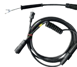
Cavo flessibile girevole completo