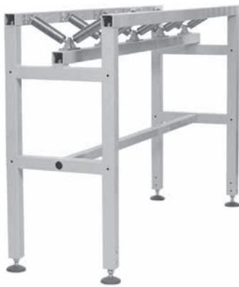
Rulliera per tubi, unità ausiliaria