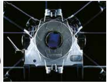
Con modulo di alimentazione AVM o MVM opzionale