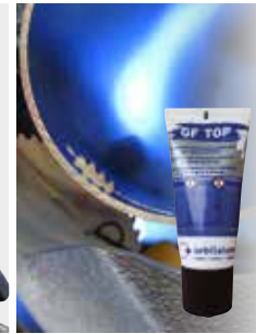
Inklusive Sägeblattschmierstoff GF TOP