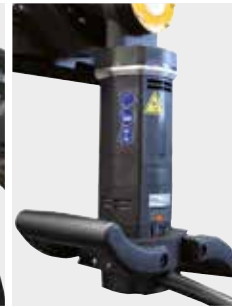
Leistungsstarker Motor mit Überlastschutz und ergonomischen Handgriffen