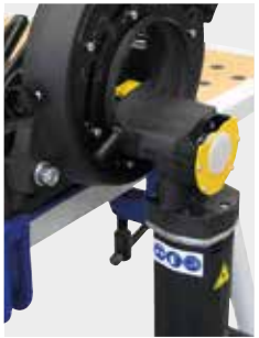
Inklusive zweite Sägeblattaufnahme zum Herausstrennen von Rohrbögen