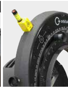
Integrierter Strichlaser zur Trennstellen-Markierung auf dem Rohr