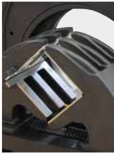
Inklusive Stahlgleitspannbacken mit Edelstahlspannaufsätzen