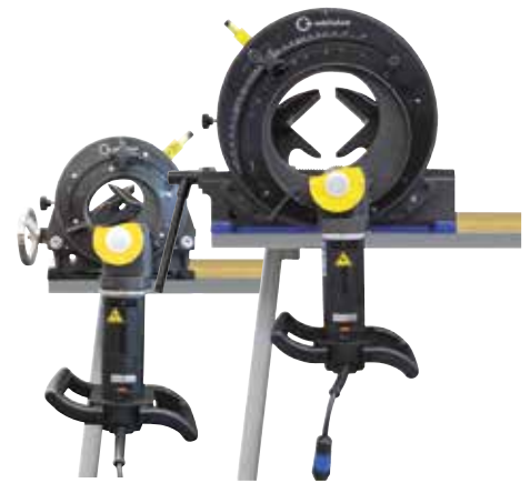
GFX 3.0, GFX 6.6

Die technischen Daten sind unverbindlich. Sie beinhalten keine Zusicherung von Eigenschaften. Änderungen vorbehalten.