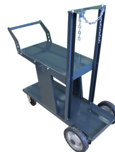
Pojazdový vozík ORBICAR S

Nie je možné použiť v kombinácii s kompresorovým chladením ORBICOOL Active.