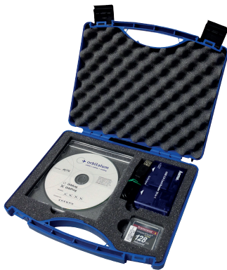
Balíček Soft-/Hardware "CA"