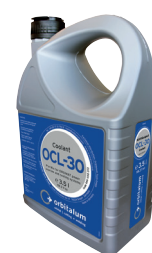
Chladiaca kvapalina OCL-30

Použitie v ORBICAR W, ORBICOOL Active, ORBIMAT 165 CB, 165 CA a 180 SW. 1 kanister je už obsiahnutý v rozsahu dodávky zdrojov prúdu ORBIMAT 165 CA a 180 SW.