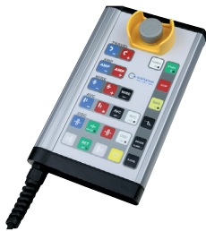
Ďiaľkové ovládanie s káblom