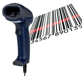
Skener čiarových kódov/QR kódov SW