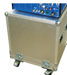
Prepravný kufor 165/300