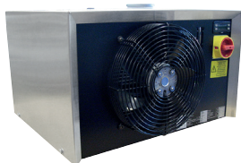
ORBICOOL Active (Pohľad zozadu)