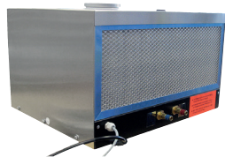
ORBICOOL Active (Pohľad spredu)

Obsahom dodávky je chladiaca kvapalina 3,5 L kanister (0.92 gal) OCL-30 (pozri str. 17). Vhodné pre všetky* zdroje prúdu ORBIMAT. Nie je možné použiť v kombinácii s pojazďovým vozíkom ORBICAR S.