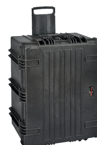
Prepravný kufor 180 SW