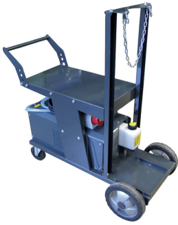
ORBICAR W pojazďový vozík s integrovaným vodným chladením