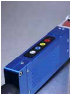
Poignée en aluminium robuste et solide avec panneau de commande intégré