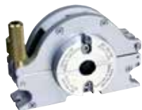
Cassette de serrage pour OW 12, type « B » (large)