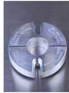
Dispositifs de serrage en aluminium pour OW 12, type « B » (large) - disponibles séparément