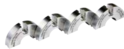
Dispositifs de serrage pour OW 12, type « B » (large), 4 pièces

En aluminium. Uniquement utilisable en cas d'emploi de la cassette de serrage type « B ». Un dispositif de serrage se compose de 4 pièces individuelles (2 dispositifs par côté).