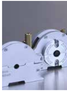
Cassettes de bridage spécifiques au diamètre - disponibles séparément