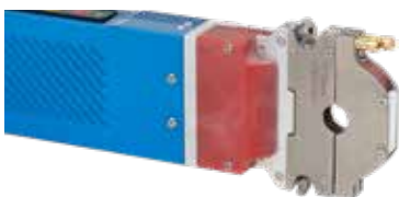
ORBIWELD 12 avec cassette de serrage étroite (type « A »)

Les caractéristiques techniques sont contraignantes. Elles ne comportent aucune garantie sur les propriétés. Sous réserve de modifications.