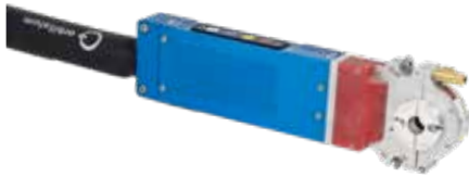
OW 12 avec cassette de serrage étroite (type « A »)