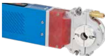
ORBIWELD 12 avec cassette de serrage large (type « B »)