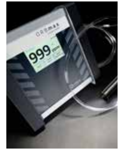
Programme d'accessoires étendu, par ex. instrument de mesure d'oxygène résiduel ORBmax