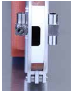
Idéal pour le soudage de tous les micro-raccords courants